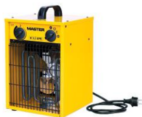
B 2 B 3