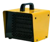
B 2PTC B 3PTC