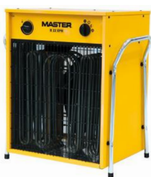
B 5 B 9 B 15 B 22