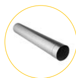
Rura wylotowa 1m ze stali nierdzewnej

Ø120mm - BF 35 - 4013.260 Ø150mm - BF 75 - 4013.243