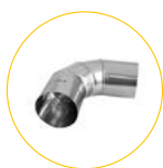
Kolano wylotowe 90° ze stali nierdzewnej

Ø120mm - BF 35 - 4013.260 Ø150mm - BF 75 - 4013.243