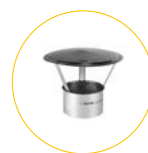
Okap kominowy ze stali nierdzewnej

Ø120mm - BF 35 - 4013.261 Ø150mm - BF 75 - 4013.247