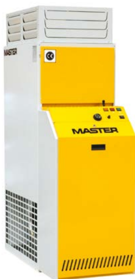
BF 35 BF 75