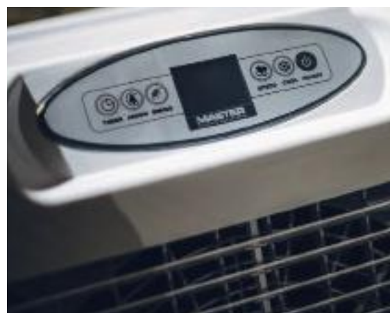
CCX 4.0 panel sterujący